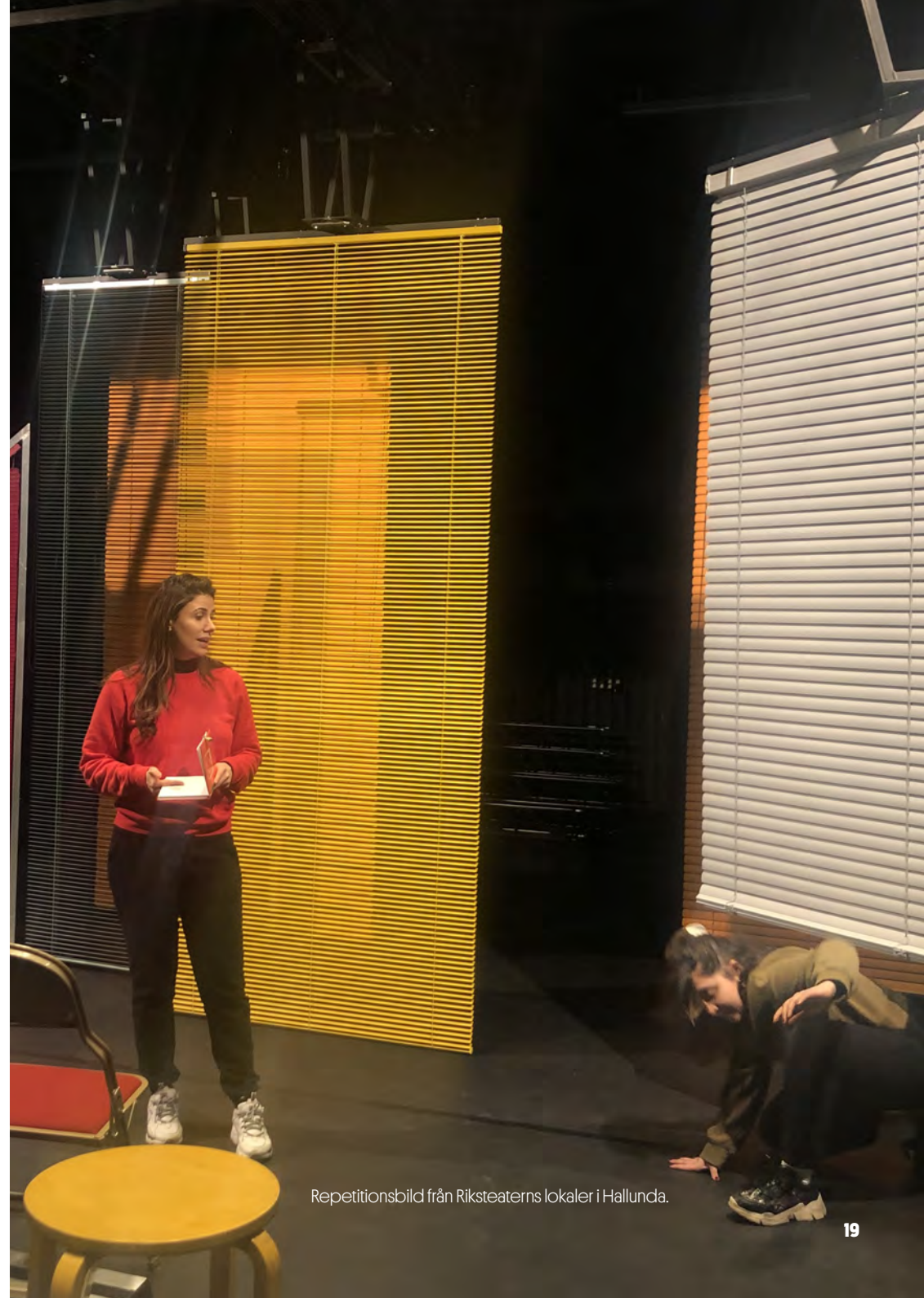
Repetitionsbild från Riksteaterns lokaler i Hallunda.