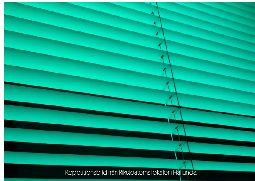
Repetitionsbild från Riksteaterns lokaler i Hållunda.

Ge eleverna i uppgift att söka fram en färsk nyhetsartikel som innehåller ordet rasism. Gå igenom artikeln och skriv ner hur begreppet rasism används och jämför detta med de olika definitioner ni tillsammans i klassen kom fram till. När alla utfört uppgiften kan ni sammanställa era resultat och se om ni kan hitta några övergripande strukturer. Är det någon variant av begreppet som förekommer mer frekvent än andra? Skiljer sig användandet av begreppet beroende på nyhetskälla?