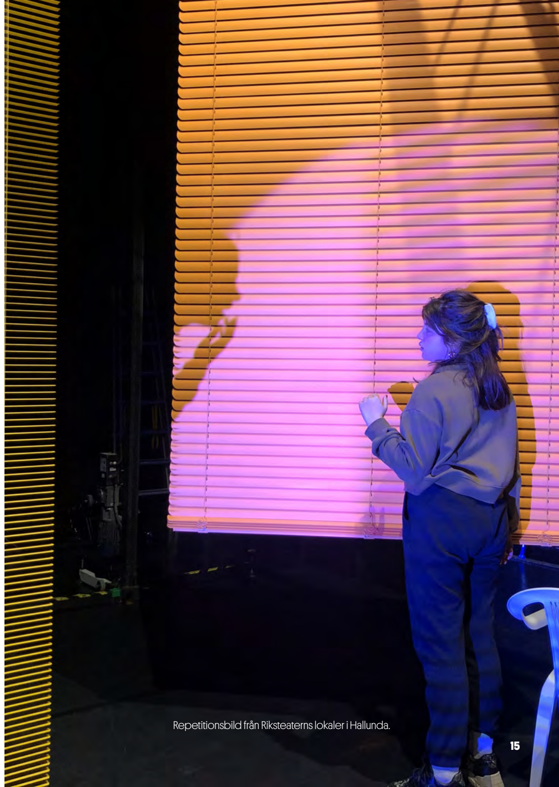
Repetitionsbild från Riksteaterns lokaler i Hallunda.

En variant är att låta eleverna ikläda sig rollen som sig själva om 15 år, eller som någon annan vuxen de ser upp till. Vad tror du att den personen skulle vilja skriva till dig att läsa om 15 år?