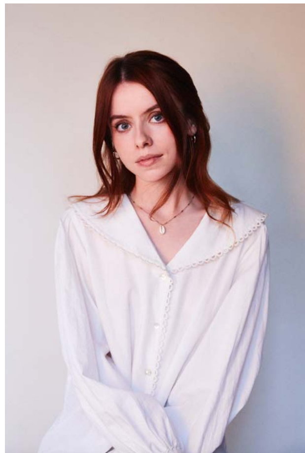
Rosie Day Dramatiker

Jag blev kontaktad efter att pjäsen hade haft premiär om att skriva en bok vilket också har varit väldigt roligt. Man kan säga att boken är en guide för tonårstjejer som vill överleva tonåren.