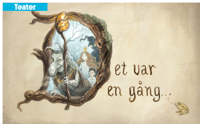
Illustration: Marta Leonhardt